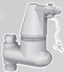
FLAMCOVENT SOLAR V